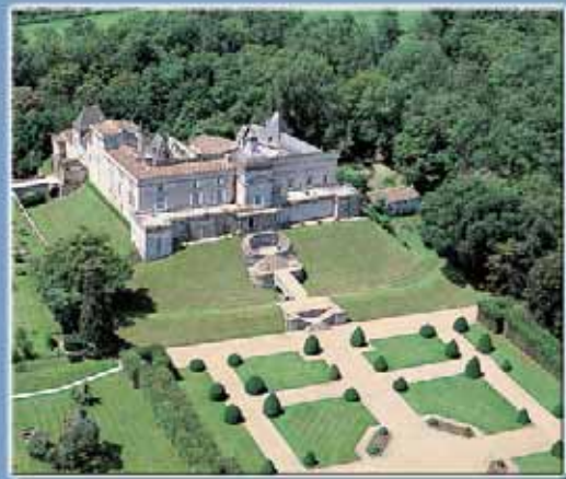
Monument historique classé Jardin remarquable Ancienne propriété d'Henri IV XVe, XVIe et XVIIe siècle

OPEN from Easter to All Saints Days. Guided tours at 3pm - 4pm - 5pm on Sundays and bank holidays. 1 July to 15 September every afternoon. Evenings : 24/7 – 7/8 – 12/8 (with "mascaret" and/or magical candle lit visit).